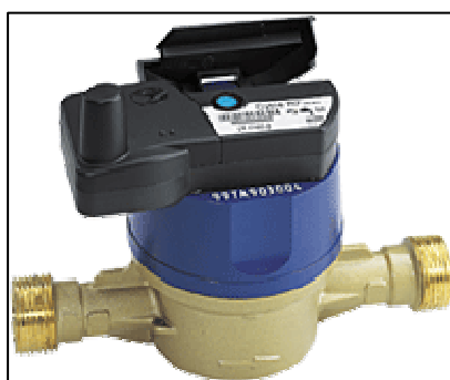
Gasmeter met telelezing

Fedesco heeft in 2009 een aanbesteding uitgeschreven om systemen voor automatische meteruitlezing te installeren in de honderd grootste federale gebouwen die bijna 50% van het totale energieverbruik voor hun rekening nemen. Deze installaties moeten, indien mogelijk, in 2010 operationeel worden. De databaseserver ging in 2009 online, maar moet nu automatisch aangevuld worden door gegevens. Fedesco zal in de loop van 2010 iemand in dienst nemen om de database doorlopend te analyseren.