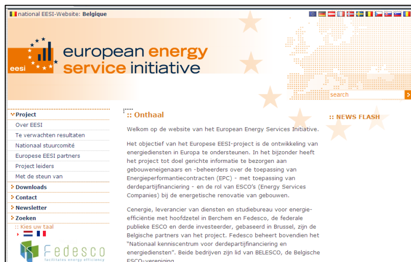
EESI-website – Pagina's voor België

Eind september heeft Fedesco een bijeenkomst gehouden met alle leden van het projectteam. Eind 2009 werd een website ontwikkeld om de deelnemende landen de mogelijkheid te bieden hun ervaring en kennis te ontsluiten. Alle leden van de vereniging krijgen als taak inhoudelijk vorm te geven aan de webpagina's die gewijd zijn aan hun land. Fedesco heeft zich daarmee belast.