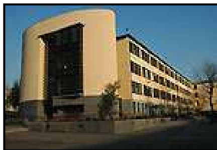
Europese school te Woluwe

Op meerdere locaties werden relevantiestudies uitgevoerd. Als eerste locatie voor de plaatsing van de eerste zonnepanelen viel de keuze op: Europese school te Sint-Lambrechts-Woluwe (Oscar Jesperslaan 75).