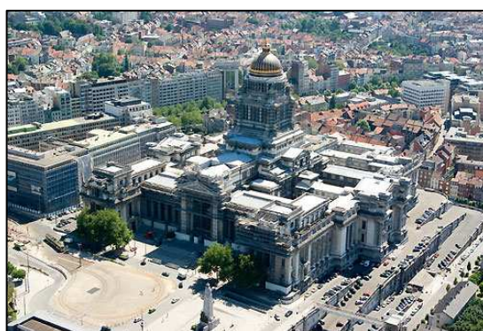
Warmtekrachtkoppeling in het Justitiepaleis van Brussel