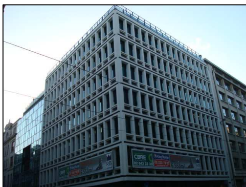
Royal Green House

Voorts valt op te merken dat Fedesco haar intrek heeft genomen in nieuwe kantoren. Deze kantoren in de Koningsstraat 47 te 1000 Brussel zijn beter afgestemd op de waarden die Fedesco hoog in haar vaandel voert. Voortaan worden klanten, leveranciers en partners in een 'groenere' omgeving ontvangen.